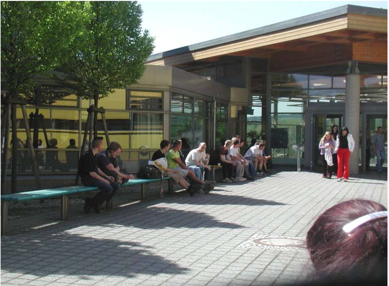
Pausenbereich zwischen Haus 1 und Haus 2

Eine Arbeit aus dem Kreativlehrgang der Tischler